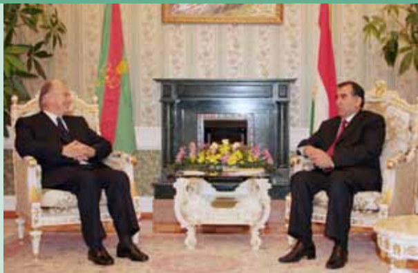
Президенти Ҷумҳурии Тоҷикистон ва Волоҳазрат Оғохон ҳангоми боздид.